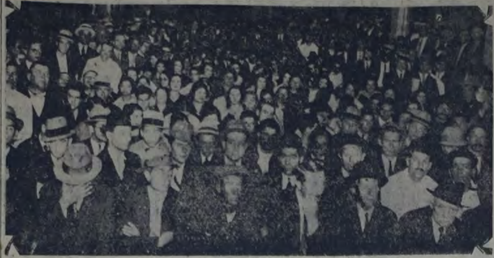
UNA VISTA DE LA ASAMBLEA REALIZADA POR LOS OBREROS GRAFICOS DE LAS CASAS PEUSER, Kraft y Compañía Fabril Financiera, después de cuatro meses de conflicto

A pesar de todas las artimañas de los industriales, el triunfo de los gráficos será rotundo